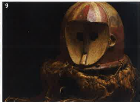
1. 仮面 (コンゴ民主共和国 ソンゲ族) と階段文様貫頭衣 (ペルー インカ文化)、2. 鹿の歯付衣装 (アメリカ クロウ族)、3. かまど面と刺子着 (日本)、4. 経絨上着 (アフガニスタン)、5. 仮面 (コートジボワール パウレ族) とラフィア椰子製スカート (コートジボワール ディダ族)、6. 厚司 (日本 アイヌ)、7. 獅子頭 (日本)、8. 動物・縞文様衣服 (ペルー インカ文化)、9. 仮面 (ブルキナファソ ボボ族)

型絵染の人間国宝として知られる芹沢銈介ですが、世界の工芸品の収集家としても広く知られています。当館には芹沢の収集品 4500 点を収蔵していますが、この展覧会では、世界の仮面と衣装をご紹介します。芹沢の収集の中でも仮面は 260 点に及び、日本をはじめ、アジア、アフリカ、南北アメリカなどのものが含まれています。人間や神、精霊などを表現した仮面には、地域の文化が色濃く反映され、優れた造形感覚や印象的な表情を見ることができます。また芹沢は、地域の伝統や暮らしから生み出される各国の衣装もこよなく